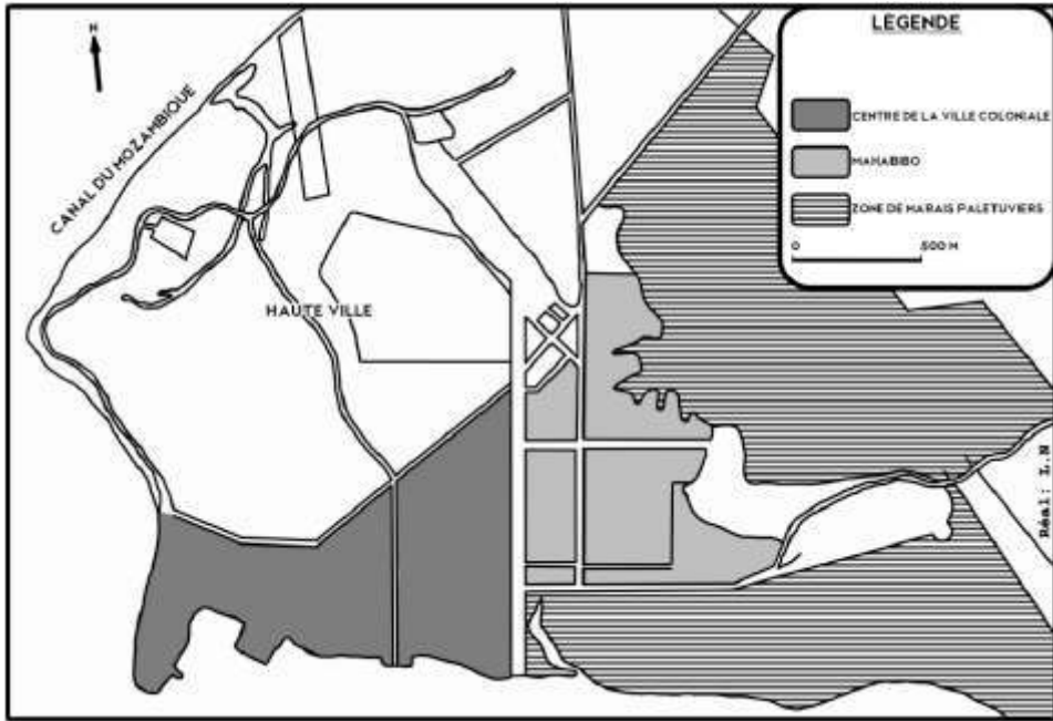
Carte de Majunga dans les années 1930-1940

de main-d'œuvre pour le port et les chemins de fer, ou de domestiques, la population africaine afflue rapidement des environs ou de régions plus lointaines.