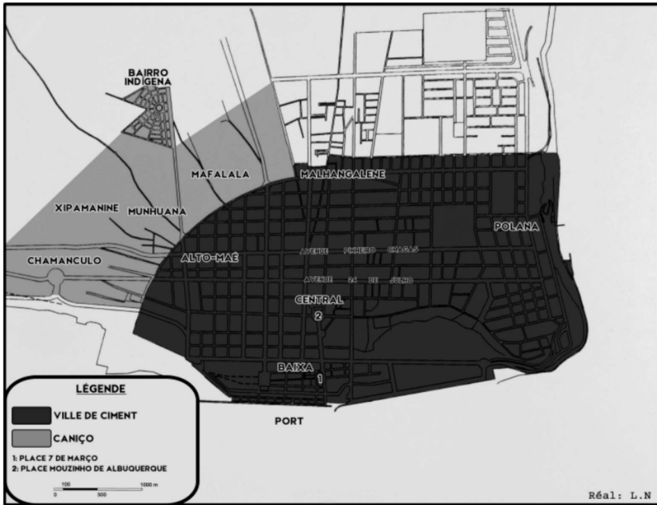
Carte de Lourenço Marques dans les années 1930-1940

Les trois villes à l'origine de cette réflexion sur les loisirs ont des rapports différents à l'histoire, à l'urbanité et à la citoyenneté. Par leur taille, leur passé, l'application plus ou moins forte de la ségrégation, le poids et le rôle de leurs élites indigènes, elles offrent un échantillon de villes utile à la connaissance du fait urbain en Afrique de l'Est et dans les îles de l'océan Indien.